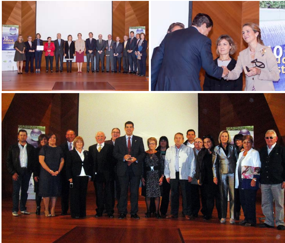
Delegación que se desplazó a Madrid, en el que se incluyen vecinos del propio Barrio de Lourdes.