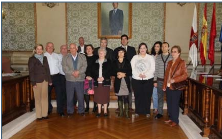
Autoridades y presidentes de 8 comunidades, tras firmar el convenio con Gobierno foral y ayuntamiento. M.T..

Un total de 608 viviendas del barrio de Lourdes de Tudela se han sumado al proyecto Lourdes Renove, que persigue fomentar actuaciones en materia de ahorro y eficiencia energética. En concreto, a los 486 pisos de la Comunidad de San Juan Bautista que decidieron en noviembre renovar el sistema de calefacción centralizada con el uso de energías renovables hay que añadir otros 122 de ocho portales que realizarán mejoras de aislamiento térmico.